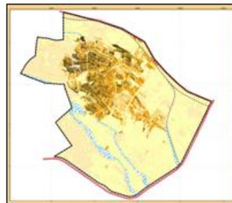
شکل ۱- موقعیت قرارگیری شهر قدس

ساختار شهر قدس مجموعه‌ای از محله‌هایی مانند: سر قنات، شاه بوداقیان، سرخه حصار، کاووسیه، قدس، عالمی، گرانمایه، ۳۰ متری و ۲۰ متری ولیعصر (عج)، شهرک شهید بهشتی، تپه میرشکار، تپه قورت داغی، امامزاده، اسماعیل آباد و شهرک عزیزی شکل گرفته است که نام برخی از آنها نشان دهنده قدمت این محله‌ها نیز هست. روند رشد کالبدی این روستای قدیمی در سه دهه گذشته چنان شتابان بوده است که کمتر اسناد مکتوبی از آن بر جای باقی مانده است. تقریباً تمامی منابع موجود روایت مشابهی را روایت می‌کنند: "از لحاظ تاریخی بخش قدس همان منطقه‌ای است که در گذشته «قلعه حسن خان» نامیده می‌شد. روستای قلعه حسن خان هسته اولیه شهر قدسی است که در سال ۱۳۴۵ روستایی با ۲۶۰۳ نفر جمعیت بوده است. در سال ۱۳۵۵ بنا بر مصوبه‌ای که تمامی کانون‌های جمعیتی دارای ۵ هزار نفر و بیشتر شناخته می‌شدند در فهرست شهرهای استان قرار می‌گیرد. جمعیت آن در این مقطع ۷۸۷۸ نفر است. در سرشماری ۱۳۶۵ از فهرست شهرهای استان تهران خارج می‌شود در حالی که جمعیت آن به ۶۶۵۵۸ نفر می‌رسد. سه سال پس از این تاریخ بار دیگر بر اساس مصوبه هیات وزیران شهر شناخته می‌شود و در سال ۱۳۷۵ جمعیت آن به ۱۳۸ هزار نفر افزایش می‌یابد. این رشد کماکان ادامه می‌یابد و در سال ۱۳۸۵ جمعیت آن به حدود ۲۳۰ هزار نفر رسیده است (مهندسین مشاور آمایش و توسعه البرز، ۱۳۹۰). در حال حاضر این شهر حدود ۴۰۰۰۰۰ نفر را در خود جای داده است.