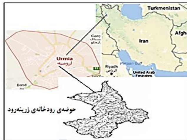
شکل ۱- موقعیت رودخانه زرینه‌رود بر روی نقشه

حوضه آبریز رودخانه زرینه‌رود در شمال غربی ایران و در جنوب شرقی دریاچه ارومیه واقع شده است. این حوضه آبریز در مختصات جغرافیایی ۴۵ درجه و ۴۵ دقیقه تا ۴۷ درجه و ۱۵ دقیقه طول شرقی و ۳۵ درجه و ۳۰ دقیقه تا ۳۶ درجه و ۴۵ دقیقه عرض شمالی گسترده شده است. مساحت حوضه آبریز زرینه‌رود حدود ۱۳۸۹۰ کیلومتر مربع است. میانگین سالانه دما در محل سد زرینه‌رود ۱/۸- درجه سانتی‌گراد برآورد شده که از حدود ۲۶/۵ درجه سانتی‌گراد درجه سانتی‌گراد در بهمن ما تا ۵ در مرداد ماه متغیر است. در شکل ۱ موقعیت رودخانه زرینه‌رود بر روی نقشه نشان داده شده است.