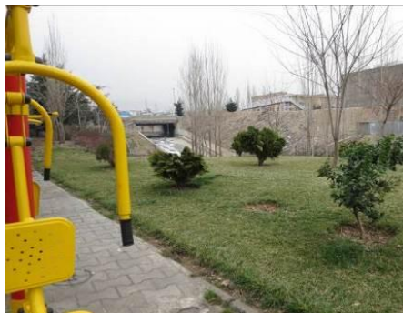
شکل ۱۲- فضای بازی کودکان در منطقه ۲ شهر تهران

در تهران، شرایط شهرسازی برای پرورش کودک آمادگی لازم را نیافته است [۲]. از سوی دیگر، کودکان تهران با این شهر آشنایی کامل ندارند، آنان حداکثر محیط پیرامون خانه خود و یا خیابان‌هایی را که بنا بر دلایلی مورد استفاده قرار می‌گیرد، می‌شناسند و با بقیه شهر آشنایی ندارند. از همین روی معابر و بافت‌های شهری و علائم راهنمایی و جهت دهنده، برای کودکان تهران خوانا نیست. آنچه که در این شهر ساخته شده برای بزرگسالان است. اصولاً کودکان در زمینه‌های مختلف در عرصه حرکت در خیابان، در فضاهای زندگی و تماس خانوادگی و در زمینه‌های شخصیت دادن به خود با مشکل مواجه می‌باشند [۲]. شرایط پریاهوی تهران، حجم ساختمان‌ها که بر اغلب آنها دود و گرد و غبار ناشی از آلودگی هوا نشسته، تابش نور بیش از حد در معابر عمومی و کمبود آن در ساختمان‌های مسکونی همجوار با هم، جایی برای آنکه کودک معصوم طبیعت را در آن پیدا کند، باقی نگذاشته است [۲]. علی‌رغم وجود تأسیسات و نهادهای مرتبط با کودک، هنوز سهم عمده‌ای از کودکان تهران از امکانات اجرایی زیستی و حقوقی که لزوم آن برای هر جامعه‌ای ضروری است، برخوردار نمی‌باشند [۲]. از جمله نهادهای بین‌المللی موجود در تهران که در کتاب آماده سازی شهر برای کودکان (اسماعیل شیعه) آماده است می‌توان به این موارد اشاره کرد: صندوق بین‌المللی فوق‌العاده سازمان ملل متحد برای کودکان (UNISEF) و آیسسکو (ISESCO). تصویر ۱۲ پارکی است در منطقه ۲ شهر تهران که قسمت اختصاص یافته به فضای بازی کودکان در نزدیک رودی بدون در نظر گرفتن بخش امنیتی و حریم قرار گرفته است که می‌تواند ایجاد خطر کند.