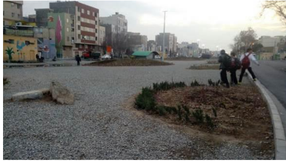
شکل ۱۴- محل سابق قرار گیری ریل راه آهن در منطقه ۱۷ شهر تهران