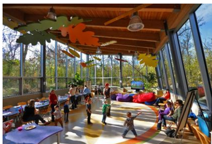
شکل ۵- مرکز خانواده در وینپگ کانادا [19]

تصویر ۵، مرکزی برای خانواده واقع در کانادا است و فضایی در هماهنگی با ریتم طبیعی اطراف آن می باشد.