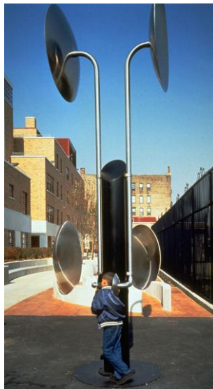
شکل ۷- محله PS 23 Sound در نیویورک [21]