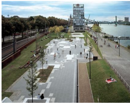
شکل ۱۰- پارک اسکیت در کلن آلمان [25]

مشخصی از روز مجاز به استفاده از این فضاها تفریحی می‌باشند [۲]. تصویر ۱۰ و ۱۱، پارکی است طراحی شده برای اسکیت که عناصر و مصالح به کاررفته در آن در فصول مختلف سال از استحکام کافی برخوردار بوده و فضایی ایمن را برای اسکیت سواری فراهم می‌کند. در عین حال دارای ارتفاع‌های مختلفی است تا هنگام پرش و فرود چشم اندازه‌های سبز و درختان پارک به زیبایی در معرض دید قرار بگیرد.