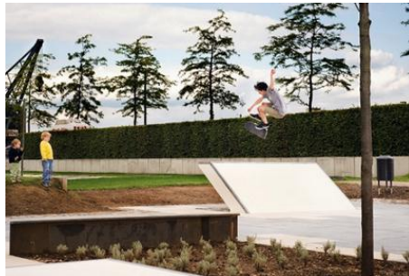
شکل ۱۱- پارک اسکیت در کلن آلمان [25]