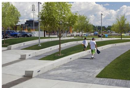
شکل ۱- پلازای شهری در انتاریو [17]