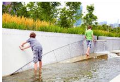
شکل ۳- پارک در تورنتوی کانادا [18]

تصاویر ۳ و ۴ منطقه ای است در مرکز شهر تورنتو (Toronto) کانادا که یک پارک شهری چند وجهی محسوب می شود. در این پروژه به انعطاف پذیری و تنوع به عنوان اصول اساسی در طراحی پارک توجه شده است. در عین حال که یک فضای آرام برای فرار از هرج و مرج از زندگی شهری است از سوی دیگر فضایی برای تعامل اجتماعی نیز می باشد.