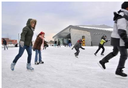
شکل شماره ۴- پارک در تورنتوی کانادا [18]

تصویر ۵، مرکزی برای خانواده واقع در کانادا است و فضایی در هماهنگی با ریتم طبیعی اطراف آن می باشد.