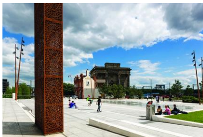
شکل ۹- پارک "است‌سایدسیتی" در بیرمنگهام [24]

در لندن، مناطقی وجود دارد که مختص کودکان می‌باشد که زندگی واقعی در جهان را برای کودکان ۴ تا ۱۴ سال معرفی می‌کند جایی که آنها می‌توانند بازی و کشف کرده و دنیای بزرگسالی را آموزش دیده و تجربه کنند. کودکان می‌توانند بیش از ۶۰ فعالیت مختلف بر اساس شرایط، دنیای کار واقعی را امتحان کرده و با کارهایی مثل خلبانی، مجری‌گری تلویزیون، دندانپزشکی و آتش‌نشانی آشنا شوند. دیگر محل‌های کار شامل تئاتر، ایستگاه رادیویی، بانک و ... است که در آن کودکان می‌توانند مدیر، کارمند و هر نقش متناسب دیگری را برعهده بگیرند. برای این تلاش کودکان پول نیز پرداخت می‌شود و کودکان می‌توانند پول خود را در بانک گذاشته و سپس از دستگاه پول خود را برداشته و غذا، هدیه و ... تهیه کنند. چنین مکان‌هایی با تاکید بر آموزش از طریق عمل و دادن نقش دیگری به کودکان، آنها را وادار به تصمیم‌گیری برای خود می‌کند [23]. تصویر ۹، مربوط به پارک شهر بیرمنگهام است که ساختار آن به گونه‌ای است که پیوند عابر پیاده را با مرکز شهر فراهم می‌کند. و دارای مسیرهای دوچرخه با هدف کاهش اتکا به اتومبیل است.