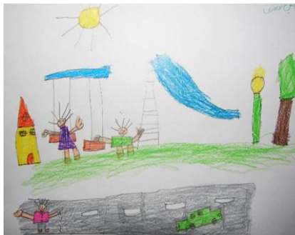
شکل ۱۵- نمونه نقاشی کودکان

در این تحقیق برای شناخت نیاز و انتظار کودکان از فضای شهری پیرامونشان از تکنیک نقاشی استفاده شده است که بهترین راه برای آشنایی با نظرات آنهاست زیرا بیشتر کودکان به نقاشی کردن علاقمند هستند و آن را محل مناسبی برای خواسته‌ها و آرزوهای خود می‌دانند. از این رو از پنجاه کودک ساکن تهران در رده سنی بین هفت تا دوازده سال خواسته شده است که فضای شهری دلخواه خود را نقاشی کنند (تصاویر ۱۵ و ۱۶).