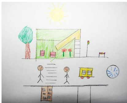
شکل ۱۶- نمونه نقاشی کودکان

در این نقاشی‌ها به مواردی چون تنوع رنگ، زمین‌های بازی، هوای پاک، امنیت، فضای سبز و جریان آب تأکید بسیار شده است. که میزان اهمیت هر یک از شاخصه‌ها از نگاه کودکان متفاوت می‌باشد (شکل شماره ۱۷).