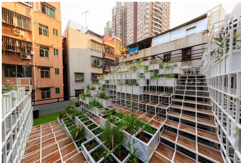
شکل ۱۱- پروژه Green Cloud، چین

امکانات فرسوده می شود و نیاز به اصلاح و نوسازی در یک محیط شهری احساس می شود. آغاز حس نیاز به تغییر و داشتن انعطاف پذیری مدیریتی برای تصویب آن تغییر، چیزی است که باعث ایجاد فضاهای عمومی و شهرهای کوچک و بزرگ عالی می شود.