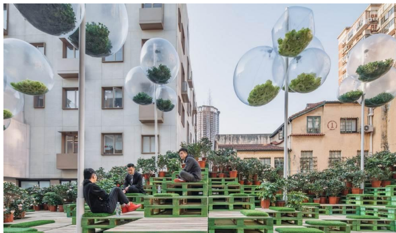
شکل ۶- پروژه Urban Bloom، چین