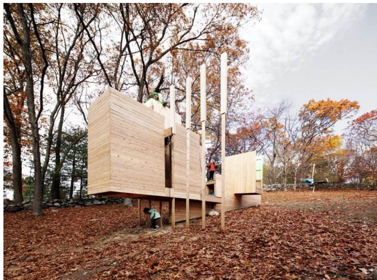
شکل ۴- پروژه Five Fields، آمریکا

با بررسی چگونگی استفاده یا عدم استفاده مردم از فضاهای عمومی، مشخص خواهد شد که چه نوع فعالیت هایی وجود ندارند و چه چیزی باید در آن گنجانده شود. علاوه بر این، هنگامی که این فضاها ساخته می شوند، ادامه مشاهدات، بینشی در مورد نحوه مدیریت آنها و تکامل آنها به مرور می دهد.