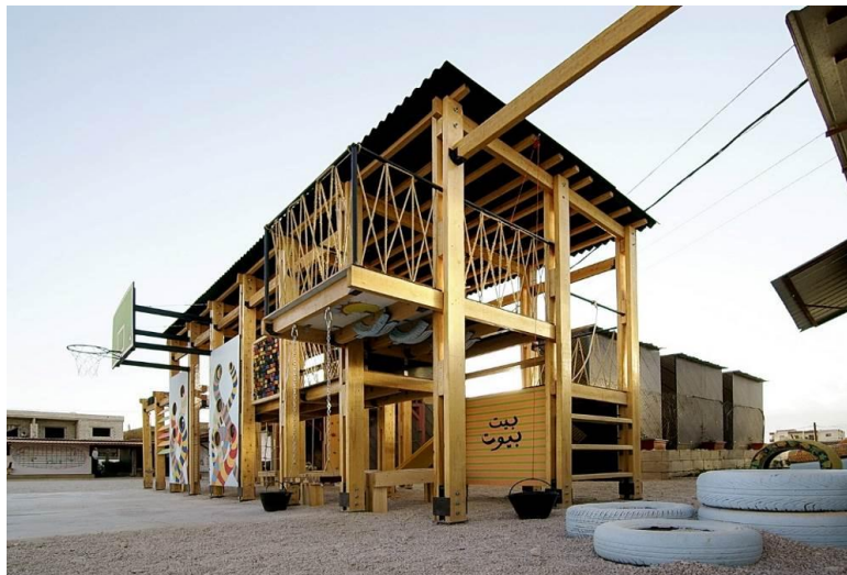
شکل ۱۰- پروژه CatalyticAction، لبنان

طرح CatalyticAction در یکی از مدارس توسعه یافته در سکونتگاه های پناهندگان در کشور لبنان، یک زمین بازی را طراحی و ساخته است، که کودکان را در کل مراحل درگیر می کند و اجازه می دهد تا ساختار طرح به راحتی از هم جدا شود، جا به جا شود، یا مجدداً ساخته شود و در کل تغییر شکل بدهد. این پروژه می کوشد تا این مفهوم را به چالش بکشد و حوادثی را که در مواقع اضطراری، ضروری به نظر می رسد گسترش دهد و تعریف یک زمین بازی را در پاسخ اضطراری زیر سؤال ببرد. این پروژه امکانات بازی و همچنین این کودکان را ترغیب می کند تا خودشان زمین بازی را طراحی کنند.