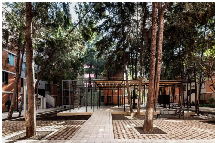
شکل ۸- پروژه San Pablo Xalpa، مکزیک

هنگام ساخت فضاهای عمومی شهری خوب، برخورد با انواع موانع اجتناب ناپذیر است، زیرا "ایجاد مکان ها" کاری نیست که برخی از متخصصان بتوانند انجام دهند. با یک فرآیند پیچیده تر، بهبود های کوچک در پرورش اجتماع می توان اهمیت "مکان ها" را نشان داد و به غلبه بر موانع کمک کرد.