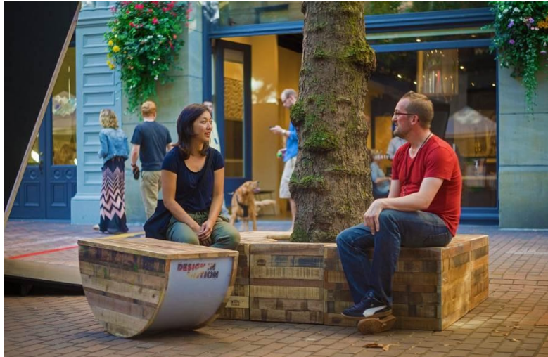
شکل ۷- پروژه Pop-Up! Street Furniture، آمریکا

طرح سه گوش، طبق گفته Holly Whyte، روندی است که بوسیله آن برخی محرک های خارجی پیوندی بین افراد ایجاد می کند و افراد غریبه را ترغیب می کند تا با هم صحبت کنند، گویی که آنها یکدیگر را می شناسند. در یک فضای عمومی شهری، انتخاب و ترتیب عناصر مختلف در رابطه با یکدیگر می تواند فرآیند طرح سه گوش (مثلث بندی) را به حرکت درآورد و افراد را به هم نزدیک کند.