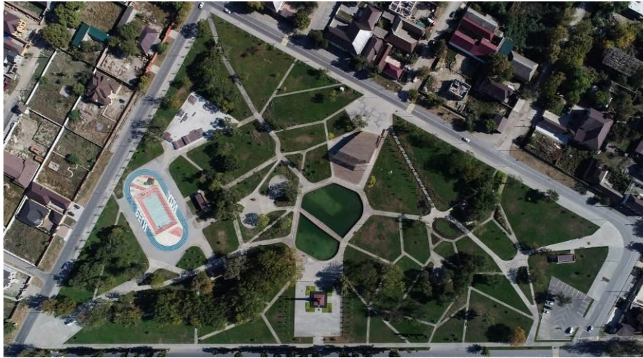
شکل ۵- پروژه پارک حسین بن تلال، روسیه

هویت مکان یک پروژه یا فضا باید از بافت پیرامونی آن مکان استخراج شود تا احساس مالکیت و حس غرور را در افرادی که در مناطق اطراف زندگی و کار می کنند، القا کند. همراه با این ایده، نوع فعالیت ها و تصویر اولیه پروژه بوجود می آید.