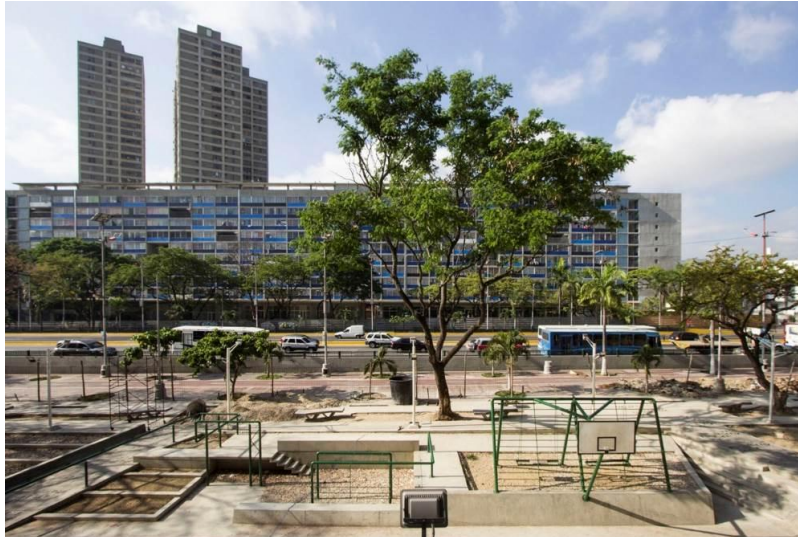
شکل ۳- پروژه Urban Amenities، ونزوئلا

Urban Amenities پروژه ای است که در آن شرکای زیادی برای ایجاد مداخله در طرح همکاری می کنند. این پروژه توسط شهرداری کاراکاس و به همراه ماموریت اجتماعی دانش و کار، سازمان Pico Collective راه اندازی شده و با حمایت جامعه سازمان یافته از منطقه، پروژه نوسازی فضاهای شهری عمومی و تفریحی را برای محیط های شهری مختلف ایجاد می کند. در طی فرآیند، نمایندگان مراکز زیربط طرح اولیه را با کارشناسان انتخاب کردند.