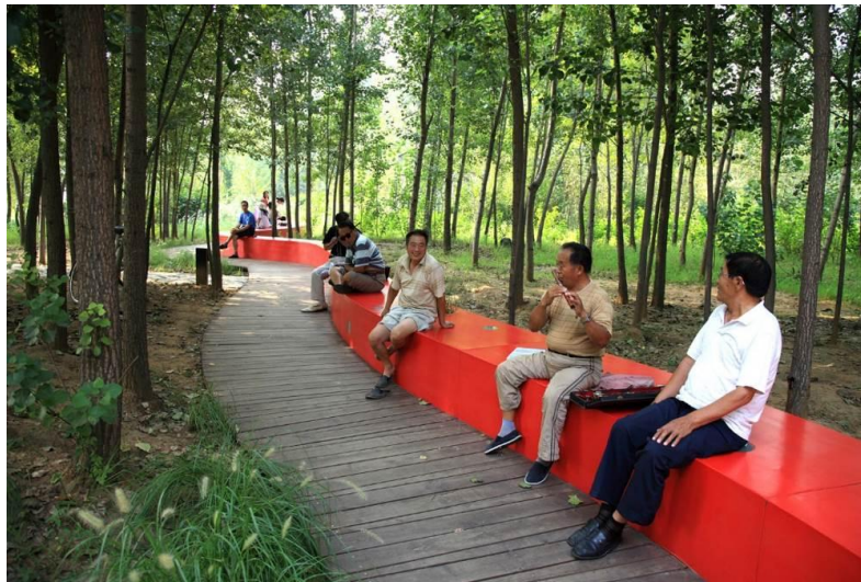
شکل ۹- پروژه روبان قرمز، چین

بازخورد از اجتماع و شرکای بالقوه، درک نحوه عملکرد سایر فضاها، تجربه و غلبه بر موانع و انتقادات مفهوم فضا را فراهم می کند. اگرچه طراحی مهم است، اما الزامات دیگری به شما می گویند برای تحقق بخشیدن به چشم انداز آینده برای فضا به چه مواردی نیاز دارید.